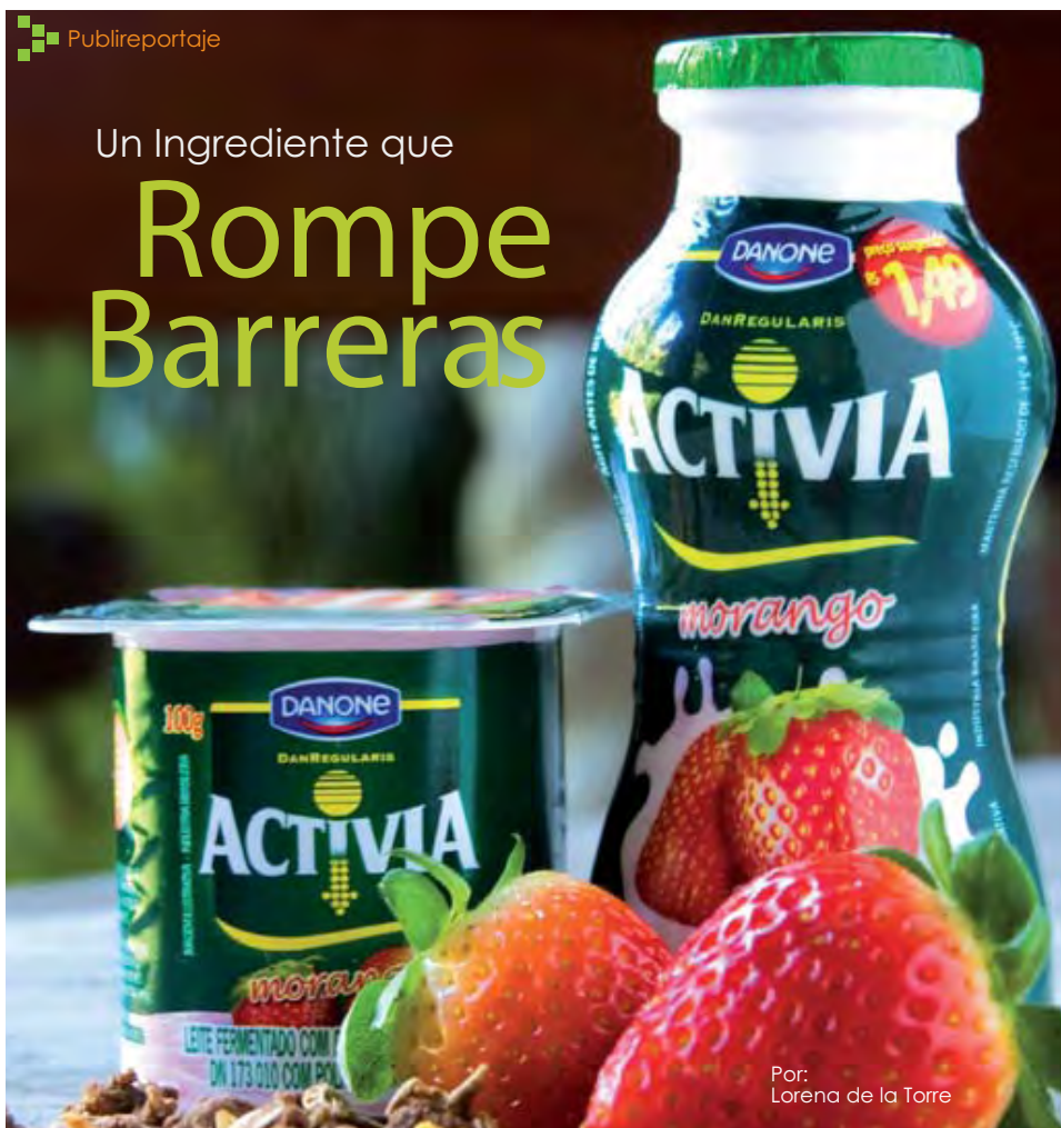
Por: Lorena de la Torre

un ingrediente prebiótico por ser un carbohidrato que, sin ser digerido, llega directamente al colon y selectivamente estimula la proliferación de bacterias benéficas (probióticas).